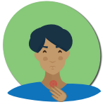
Mal de gorge