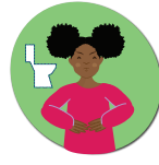
Vomissements ou diarrhée