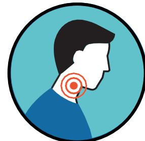
Mal de gorge, difficulté à avaler