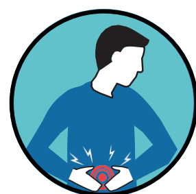
Diarrhée, nausées, vomissements